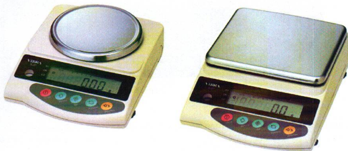
Рисунок 1 - Общий вид весов неавтоматического действия SJ.

Принцип действия весов основан на преобразовании частоты вибрации акустического весоизмерительного датчика, возникающей при его растяжении или сжатии под действием взвешиваемого груза, в цифровой электрический сигнал, изменяющийся пропорционально массе взвешиваемого груза. Результаты взвешивания выводятся на дисплей.