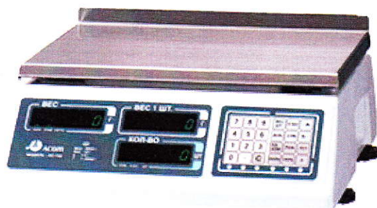
Рисунок 1 - Общий вид весов электронных АС-100.

Общий вид весов представлен на рисунке 1.